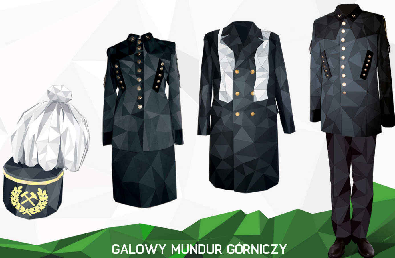
Górnik (I stopnia)